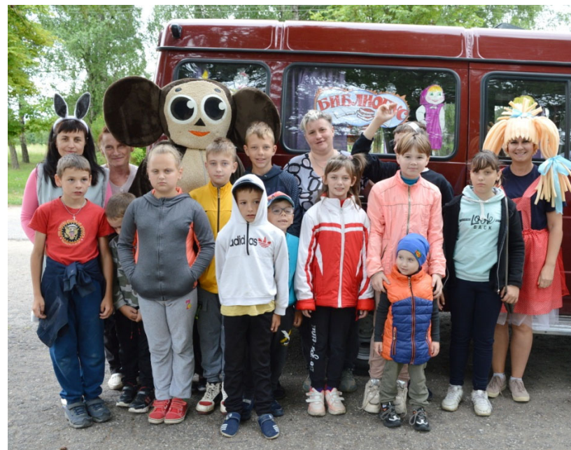
ДУК «Сенненская цэнтралізаваная бібліятэчная сістэма» Дзень вясёлых забаў у рамках абласнога праекта «Ура! Канікулы: у аб'ектыве дзеці»

У Варанцэвіскай бібліятэцы-філіяле Талачынскага раёна трэці год запар рэалізоўваўся краязнаўчы праект «Крочым родным краем, старонкі гісторыі збіраем». У рамках праекта працягвалася пошукава-даследчая праца па выяўленні і збору дакументаў, якія дапамогуць захаваць памяць