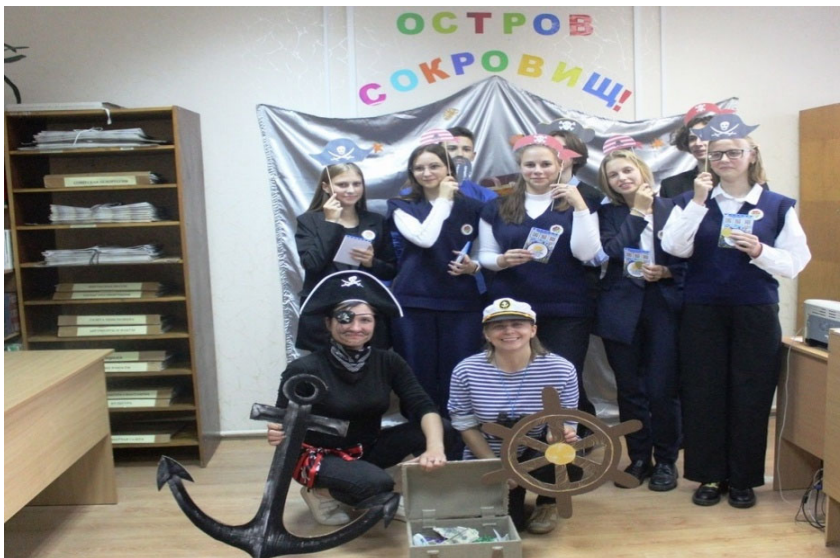
ДУК «Цэнтралізаваная бібліятэчная сістэма Расонскага раёна» Квэст «Востраў кніжных скарбаў»

аб подзвігу ўдзельніка партызанскага руху Героя Савецкага Саюза М. Тапвалдыева, перапіска з ветэранамі і ўдзельнікамі Вялікай Айчыннай вайны, землякамі М. Тапвалдыева з Ферганы, вывучэнне краязнаўчай літаратуры і архіўных матэрыялаў. У выніку складзена і аформлена тэматычнае дасье «Слова пра Героя» (старонкі жыцця Героя Савецкага Саюза, камандзіра разведкі партызанскай брыгады «Чэкіст» Мамадалі Топвалдыева). Сабраны ўнікальныя звесткі аб партызанскім руху на тэрыторыі краю, гісторыі калгаса «Камсамольская праўда», радаводзе асобных сямей. За тры гады рэалізацыі праекта назапашана вялікая колькасць краязнаўчых матэрыялаў, якія сфарміраваны ў тэматычныя папкі. У справаздачным годзе дапоўнены матэрыяламі і новымі раздзеламі рэсурсы «Летапіс вёскі Варанцэвічы», «Вёска. Час. Людзі», «Гісторыя роднай вёскі», «А ў нашых хатах майстры жывуць».