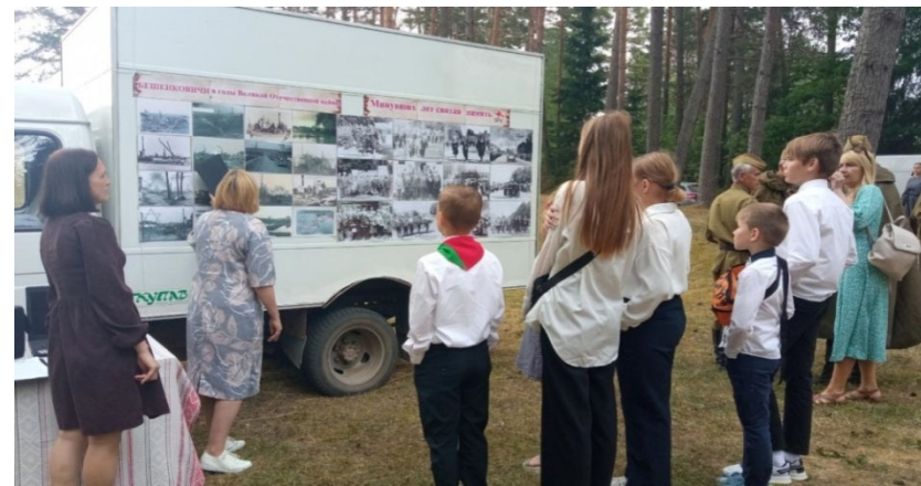
ДУК «Бешанковіцкая цэнтралізаваная бібліятэчная сістэма» Фота-экскурс «Мінулых гадоў святая памяць» на мемарыяльным комплексе «Узрэчча»

У верасні ў Тулаўскім сельскім доме культуры ДУК «Віцебскі раённы цэнтр культуры і творчасці» адбыўся метадычны дзень, на якім былі падведзены вынікі абласнога сумеснага праекта ўстановаў культуры па формах нестатыянарнага абслугоўвання насельніцтва «Ура! Каникулы: у аб'ектыве дзеці». Праект, арганізатарамі якога выступалі ўпраўленне культуры Віцебскага аблвыканкама, Віцебскі абласны метадычны цэнтр народнай творчасці, Віцебская абласная бібліятэка імя У.І. Леніна, праходзіў на працягу летніх месяцаў. Унікальнасць праекта – у партнёрскай дзейнасці супрацоўнікаў бібліёбусаў і аўтаклубаў, якія выязджалі ў аддаленыя вёскі сваіх раёнаў з сумеснымі мерапрыемствамі, выставамі, майстар-класамі, конкурсамі, прызванымі разнастаіць летні вольны час дзяцей у сельскай мясцовасці. Па выніках праекта сярод дасланных партфолія журы выбрала лепшых удзельнікаў: установы культуры Дубровенскага, Лёзненскага, Талачынскага і Шаркаўшчынскага раёнаў.