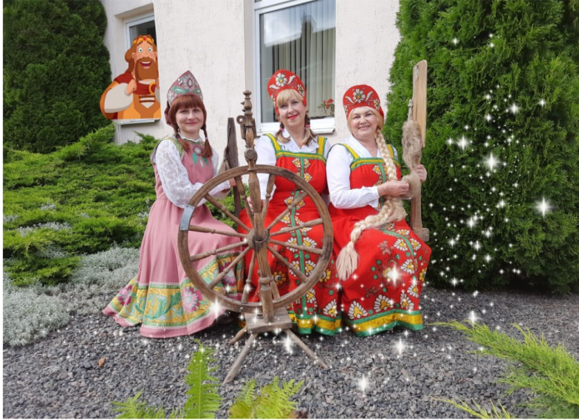
ДУК «Пастаўская раённая цэнтралізаваная бібліятэчная сістэма» Раённы конкурс «Бібліятэкар у вобразе літаратурнага героя»