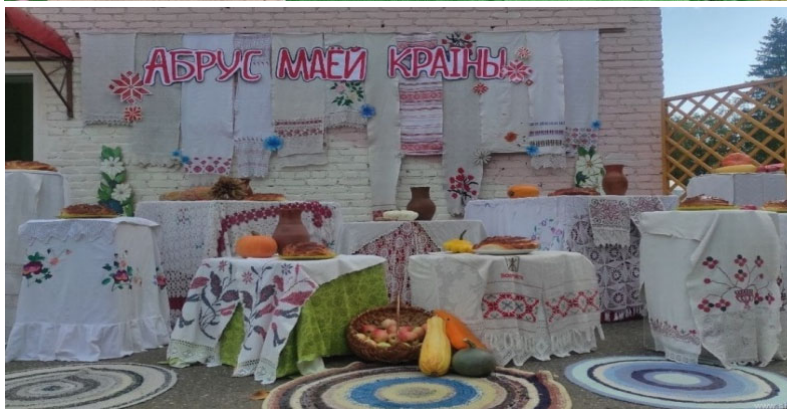
ДУК «Шумілінская цэнтралізаваная бібліятэчная сістэма» Народны калектыў «Літаратурна – музычная гасцеўня «Крыніца», тэматычная пляцоўка «Абрус маёй краіны»

«Я вырос здесь и край мне этот дорог» у Полацкай РЦБС. У Відзаўскай бібліятэцы ЦБС Браслаўскага раёна актыўна рэалізаваўся школьна-бібліятэчны грамадзянска-патрыятычны праект «Жыву ў Беларусі – і тым ганаруся», у рамках якога былі праведзены гісторыка-інфармацыйная гадзіна «Гістарычны шлях і развіццё сінявокай Віцебшчыны за 85 гадоў», бліц-віктарына «Аб Віцебшчыне, пра Віцебшчыну». Ушацкая ЦБС працавала па праекце «Беларусь – мая краіна», які ўключаў акцыі і мерапрыемствы ваенна-патрыятычнага характару, ініцыяваныя раённай бібліятэкай і рэалізаваныя ў творчай садружнасці з культурнымі і адукацыйнымі ўстановамі, грамадскімі арганізацыямі раёна.