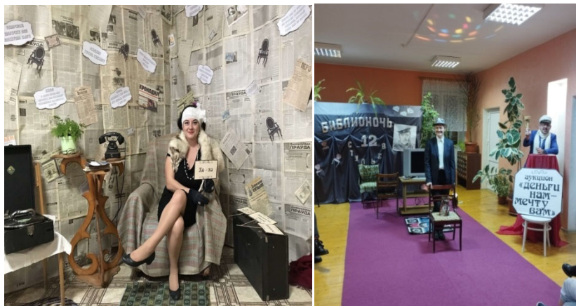
ДУК «Дубровенская централизованная библиотечная система» Бібліяноч – 2023 «12 стульев»