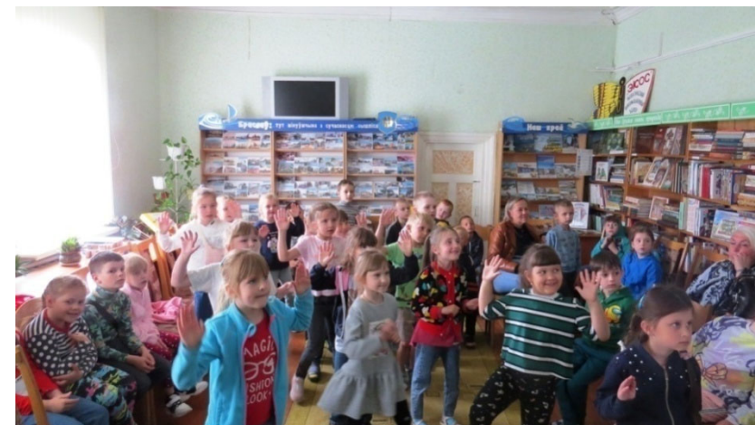
ДУК «Цэнтралізаваная бібліятэчная сістэма Браслаўскага раёна» Восеньскія каникулы ў дзіцячай бібліятэцы