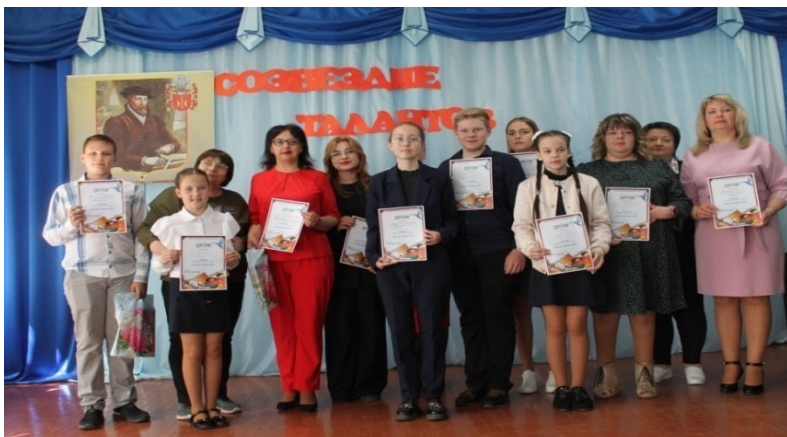
ДУК «Чашніцкая раённая цэнтралізаваная бібліятэчная сістэма» Раённы конкурс чытальнікаў «Нам свет завешчана берагчы» у рамках фестывалю Васіля Цяпінскага