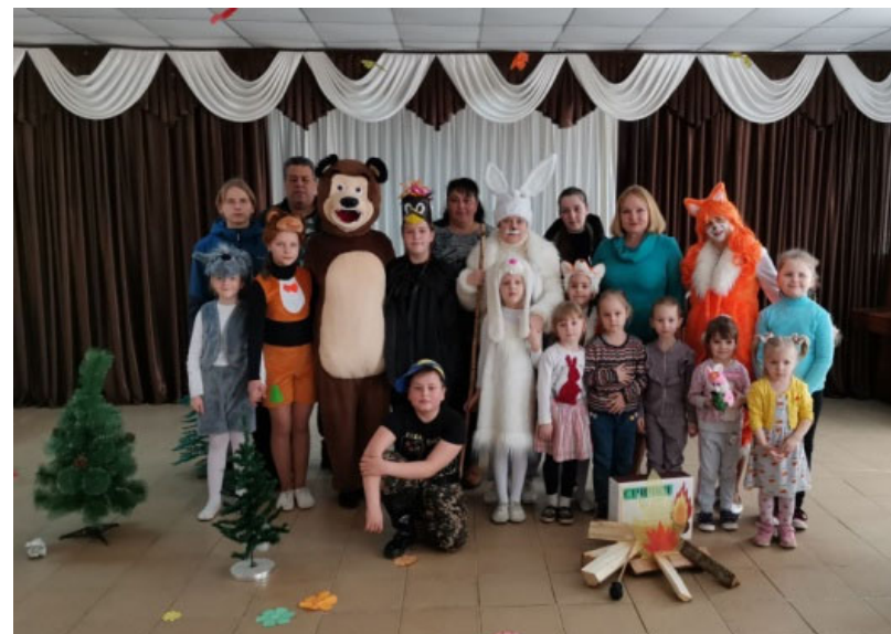
ДУК «Віцебская раённая цэнтралізаваная бібліятэчная сістэма» Квэст «Да вытокаў душой дакраніся», тэатралізаванае прадстаўленне «Лясны сход»