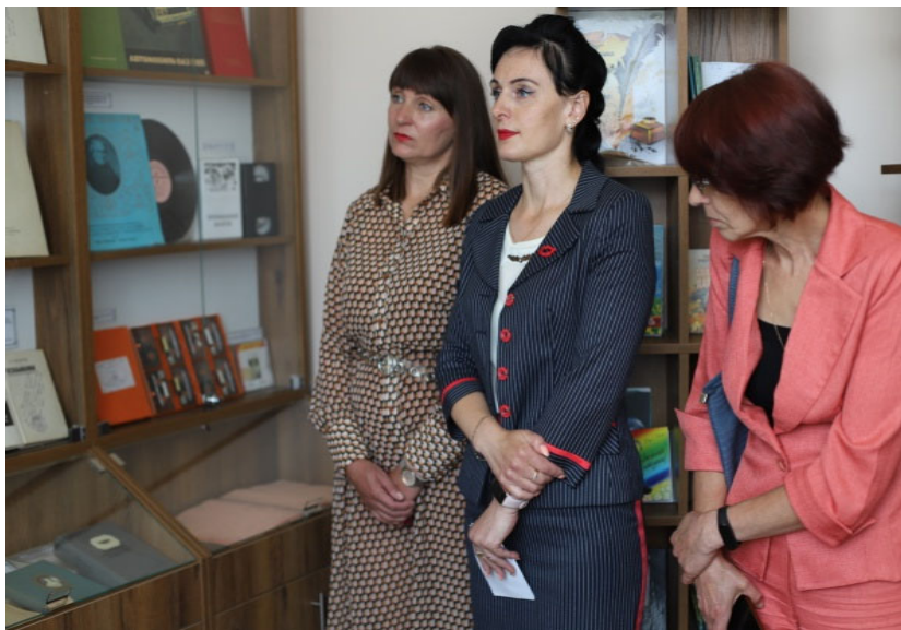
ДУК «Лепельская централизованная библиотечная система» Адкрыццё экспазіцыі «Книга – вярэнь звязваючая нить»

майстроў, выставы сельскагаспадарчай прадукцыі: свята вёскі Латыгаль «Жыву і дыхаю, мой край, табой...» (Глыбоцкая ЦБС); свята вёскі Валодзькі «Мой родны куток, мая родная вёска» (Докшыцкая ЦБС) і інш.