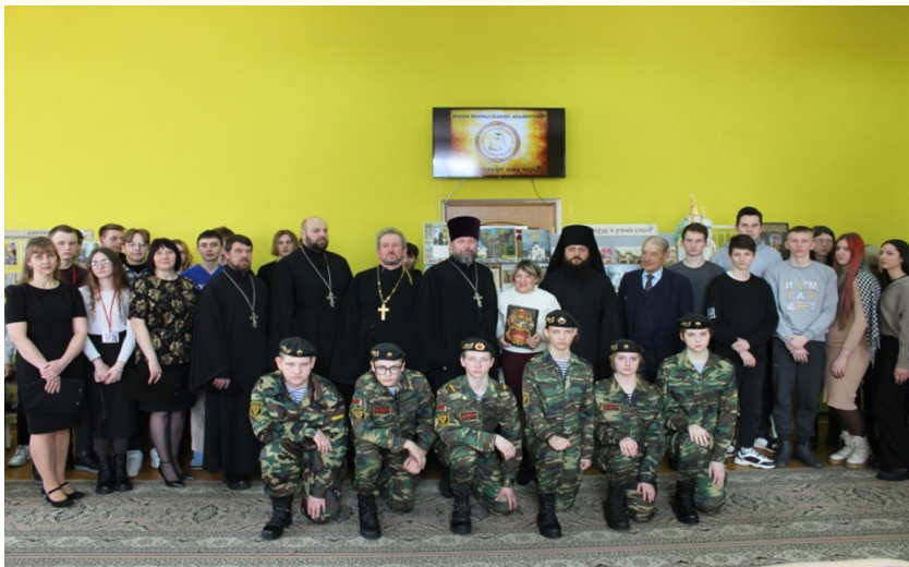
ДУК «Аршанская цэнтралізаваная бібліятэчная сістэма» Адкрыццё фестывалю праваслаўнай кнігі «Дарогамі праваслаўя»

Спецыяльным дыпломам за папулярызаванне традыцыйнай народнай культуры сродкамі дзіцячай творчасці адзначаны Глыбоцкая ЦБС і Глыбоцкі ЦТКіНТ. Падчас метадычнага дня ўдзельнікі выступалі з прэзентацыяй сваёй дзейнасці. Супрацоўнікі аддзела бібліятэчнага абслугоўвання насельніцтва прынялі ўдзел у дыялогавай пляцоўцы «Нестацыянарнае культурнае абслугоўванне насельніцтва. Позірк у заўтра», дзе прайшло абмеркаванне праекта, былі вызначаны перспектывы развіцця нестацыянарных форм абслугоўвання насельніцтва ў сельскай мясцовасці.