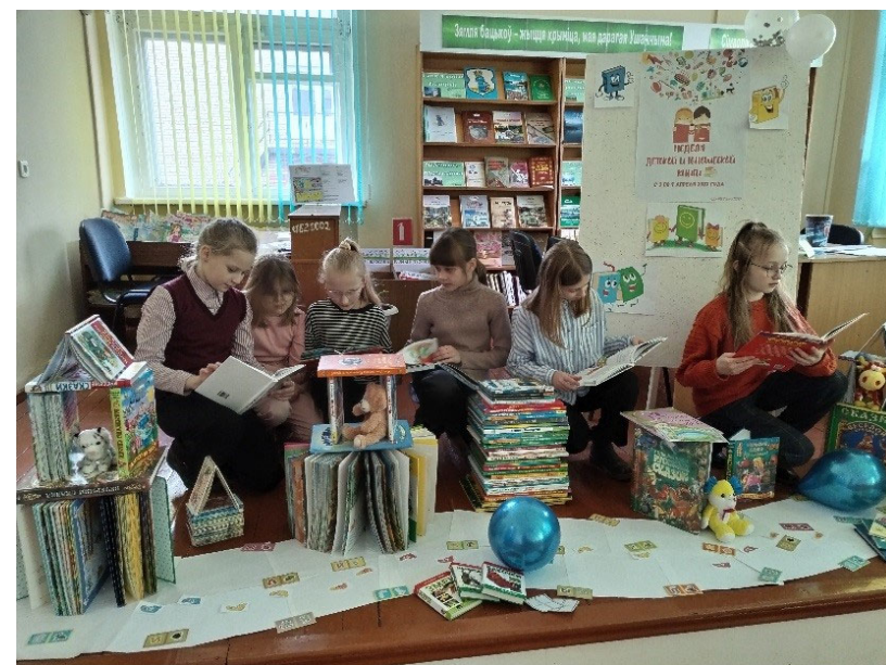
ДУК «Ушацкая цэнтралізаваная бібліятэчная сістэма» Тыдзень дзіцячай і юнацкай кнігі