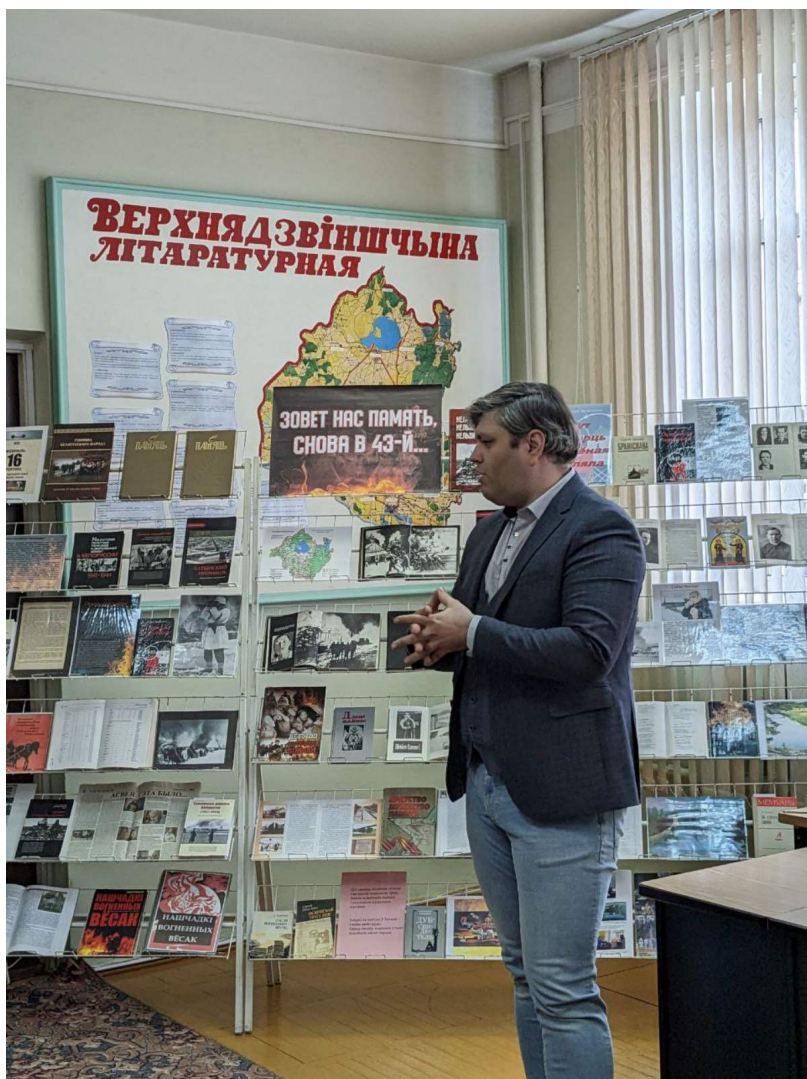
ДУК «Верхнядзінская цэнтралізаваная бібліятэчная сістэма» Навукова-практычная канферэнцыя «Вялікая Айчынная вайна ў гістарычнай памяці народа»

пры ўдзеле супрацоўнікаў ФАП праводзіліся прафілактычныя гутаркі, абмеркаванні.