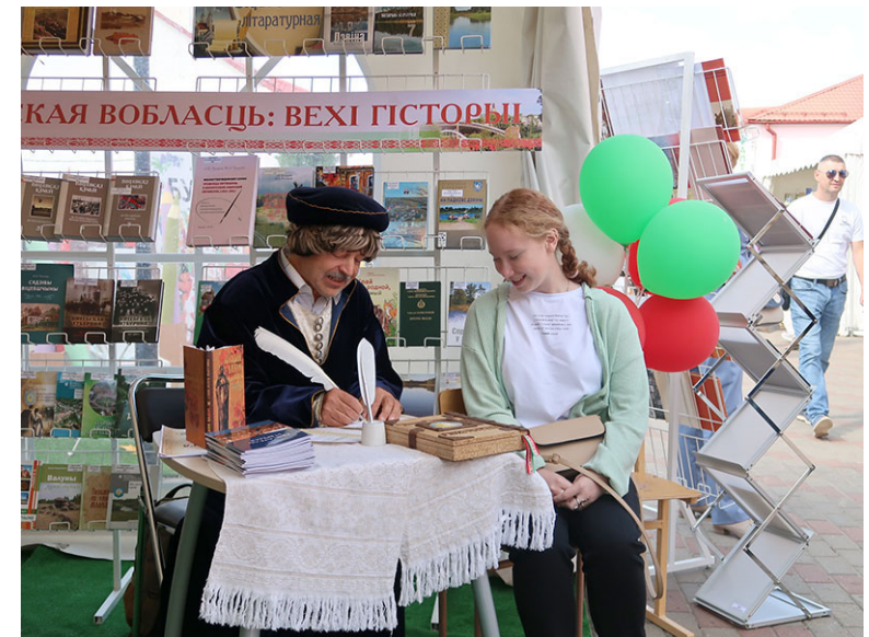
ДУ «Віцебская абласная бібліятэка імя У.І. Леніна» Бібліятэчная пляцоўка ў рамках XXX Дня беларускага пісьменства ў Гарадку