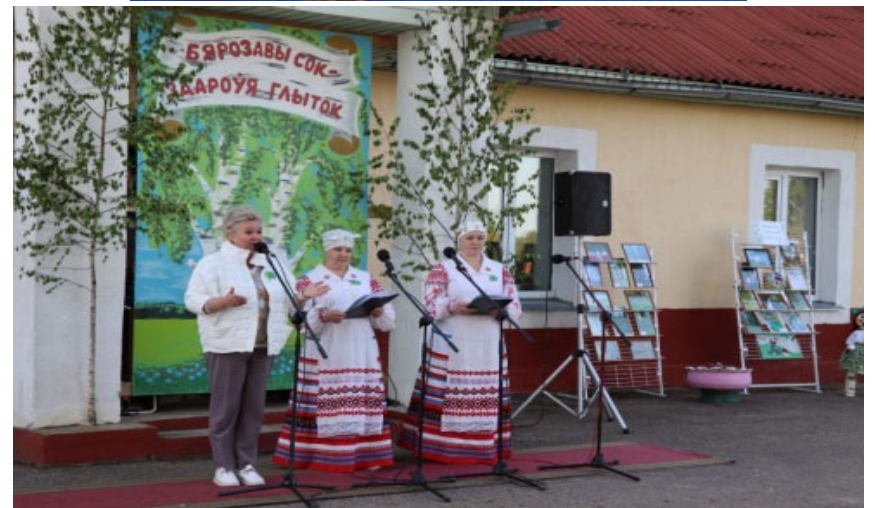
ДУК «Докшыцкая цэнтралізаваная бібліятэчная сістэма»

Праект «Кніга пачынаецца з пісьменніка», святая «Бярозавы сок – здароўя глыток»