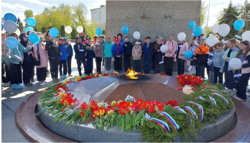
ДУК «Цэнтралізаваная бібліятэчная сістэма г. Віцебска» Акцыя памяці загінуўшых у гады Вялікай Айчыннай вайны «Дзень белых жураўлёў»