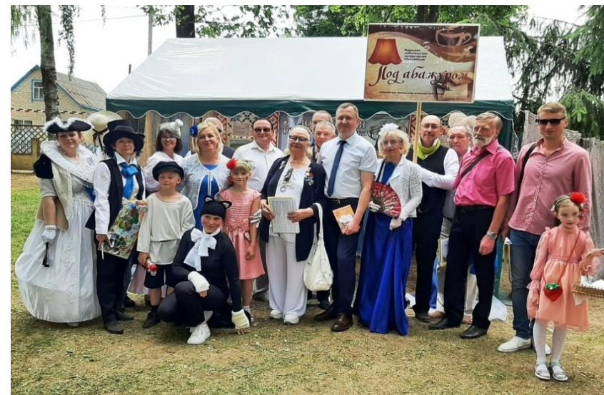
ДУК «Лёзненская цэнтралізаваная бібліятэчная сістэма» Абласное свята-конкурс самадзейных паэтаў і кампазітараў «Песні сунічных бароў–2023»

Амаль ва ўсіх вёсках Віцебскай вобласці сумесна з сельскімі выканаўчымі Саветамі і сельскімі дамамі культуры ладзяцца святы вёскі. Гэтыя святы – аднаўленне даўно забытых традыцый. Правядзенню такога свята папярэднічае вялікая работа па збору матэрыялаў пра гісторыю вёскі і яе жыхароў. У час мерапрыемства адбываецца ўшанаванне ветэранаў вайны і працы, перадавікоў сельскагаспадарчай вытворчасці, старажылаў вёскі. Надоўга застаюцца ў памяці вяскоўцаў і выставы творчасці народных