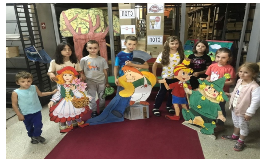
ДУК «Цэнтралізаваная бібліятэчная сістэма г. Наваполацка» Квэст «Казачнае асарці»