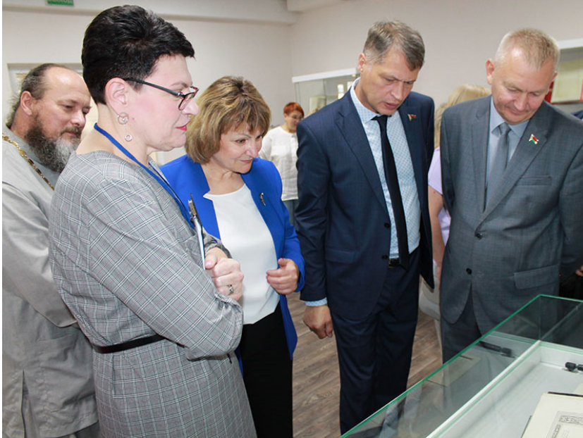
ДУ «Віцебская абласная бібліятэка імя У.І. Леніна» Адкрыццё выставачнай залы «ExLibris»