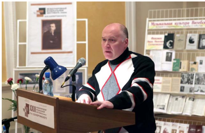
Выступление на научных чтениях XXIII Международного музыкального фестиваля им. И. И. Соллертинского, 2011 г.