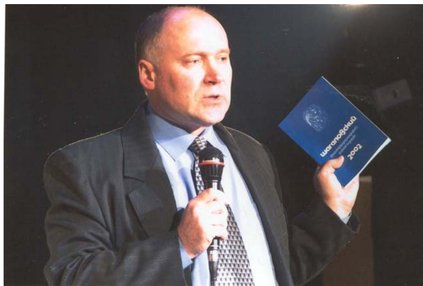
Презентация первого выпуска Шагаловского ежегодника, 2003 г.