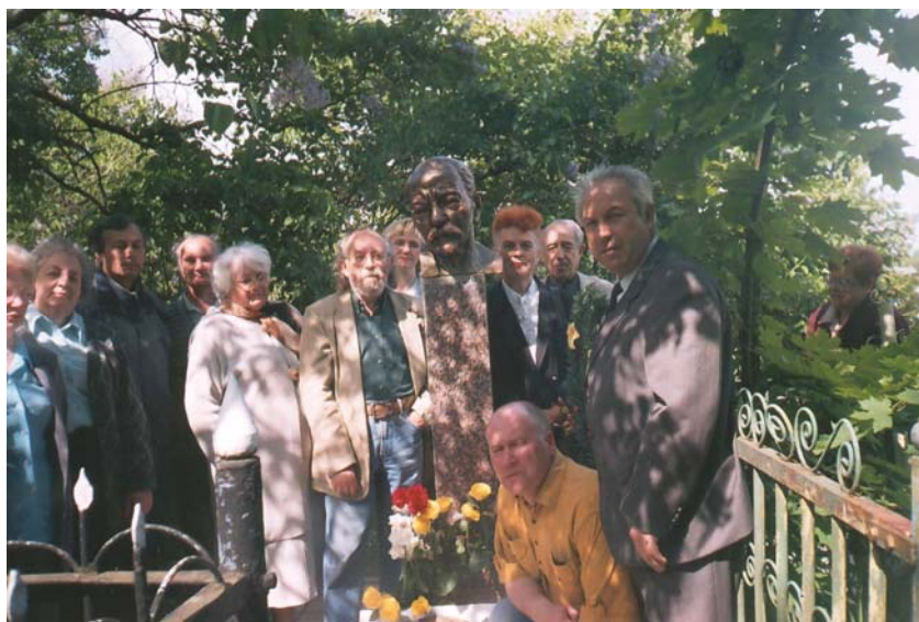
У могилы Ю. Пэна в день 150-летия со дня его рождения, 2004 г.