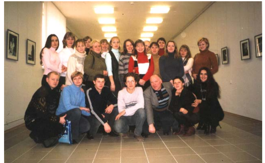
На открытии выставки со студентами 41-й группы ФБФИ ВГУ им. П. М. Машерова, 2005 г.

участие с докладом в 3-х Шагаловских чтениях в Витебске.