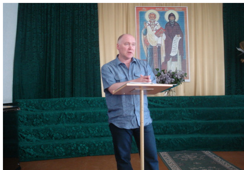
На XV Славянских чтениях (г. Даугавпилс, Латвия), 2010 г.