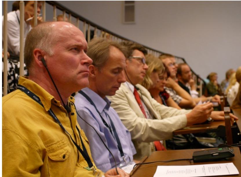
На Европейском региональном конгрессе ICCEES (Берлин, Германия), 2007 г.