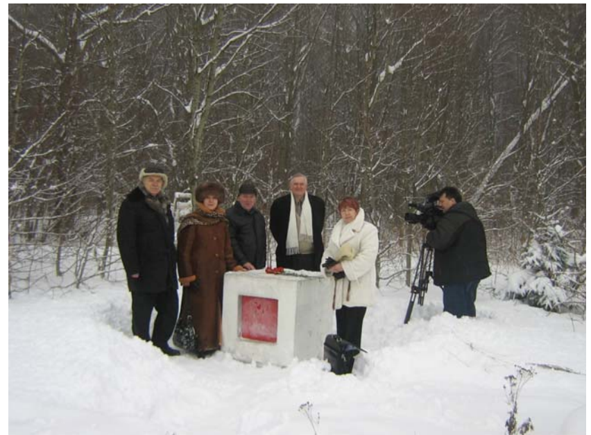
На могиле К. С. Малевича (Немчиновка, Подмоскowie), 2006 г.