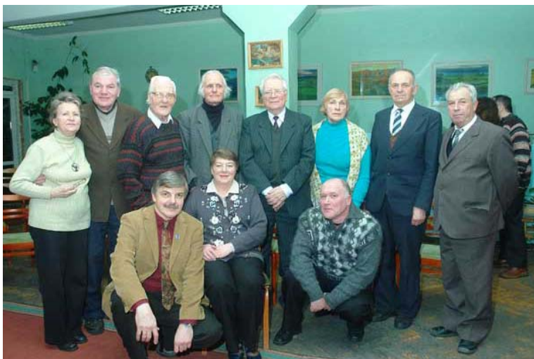
Вечер памяти художника В. А. Смерединского в Витебской областной библиотеке, 2009 г.