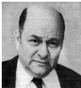
ЦВЯРСКІ АЛЯКСАНДР ДАВЫДАВІЧ 100 год з дня нараджэння (1924)

Цвярскі Аляксандр Давыдавіч (1924–1990) – савецкі пісьменнік, паэт, перакладчык, сцэнарыст, ураджэнец Беларусі. Член Саюза пісьменнікаў СССР з 1960 года.