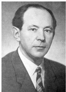
МЕЙЛАХ БАРЫС САЛАМОНАВІЧ 115 год з дня нараджэння (1909)

Мейлах Барыс Саламонавіч (1909–1987) – савецкі філолаг, тэкстолаг, педагог, культуролог, доктар філалагічных навук, пушкініст.