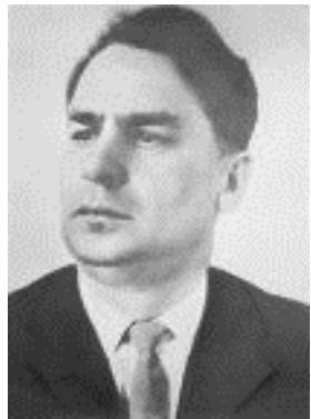
ЦЯБУТ ДЗМІТРЫЙ ВАСІЛЕВІЧ 110 год з дня нараджэння (1914)

Цябут Дзмітрый Васілевіч (1914–1987) – партыйны і дзяржаўны дзеяч БССР, адзін з арганізатараў і кіраўнікоў патрыятычнага падполля і партызанскага руху ў Віцебскай вобласці ў Вялікую Айчынную вайну.