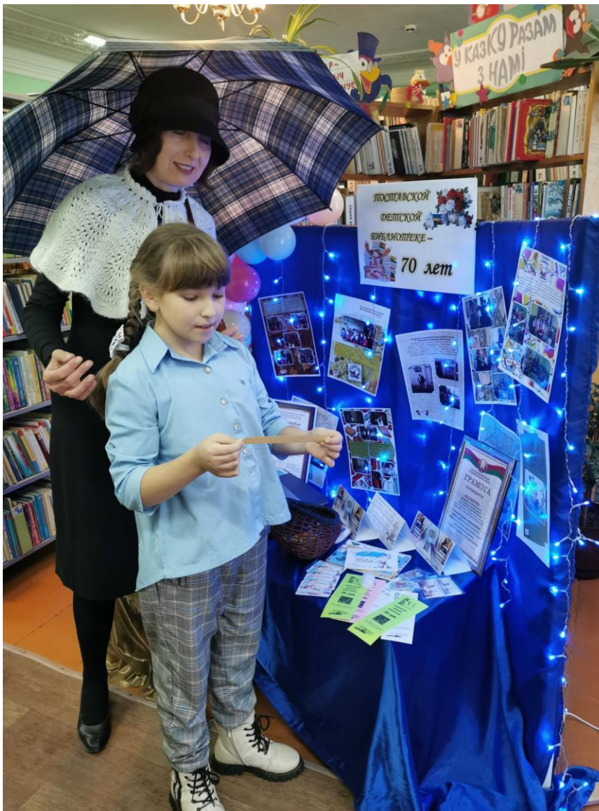
”Юбілей – 70 год“ Раённая дзіцячая бібліятэка імя У.Дубоўкі Пастаўскай ЦБС