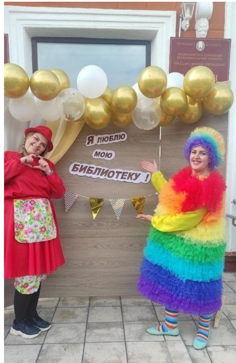
”Юбілей – 75 год“ Дзіцячая бібліятэка Шумілінскай ЦБС