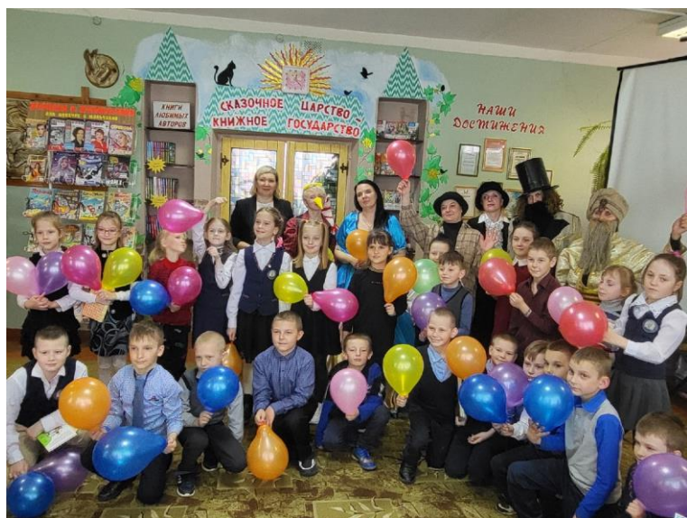
”Бенефіс чыгача“ Сектар дзіцячай літаратуры цэнтральнай раённай бібліятэкі Дубровенскай ЦБС