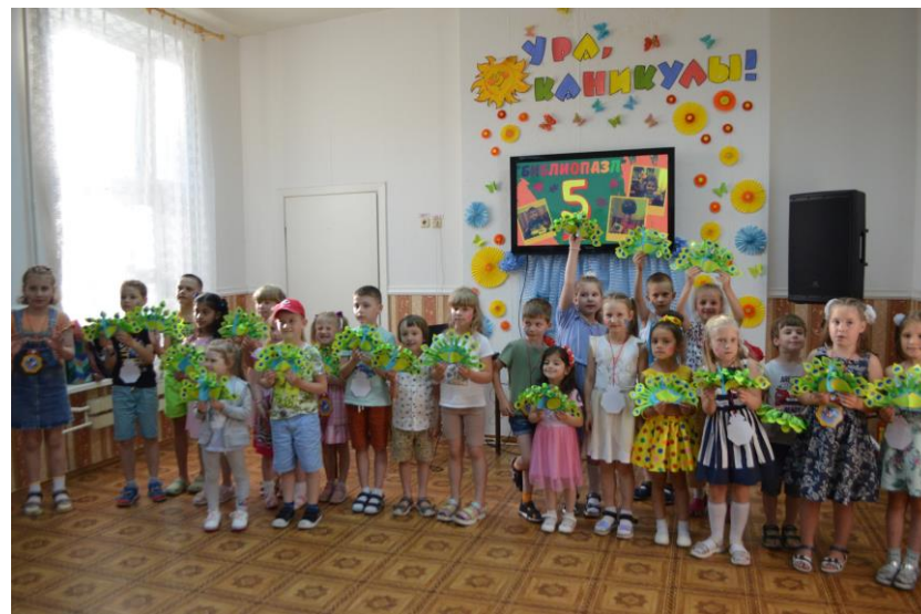
Цэнтру чытання і актыўнай творчасці "Бібліяпазл" – 5 год Дзіцячая бібліятэка імя Л. Талстога Полацкай РЦБС