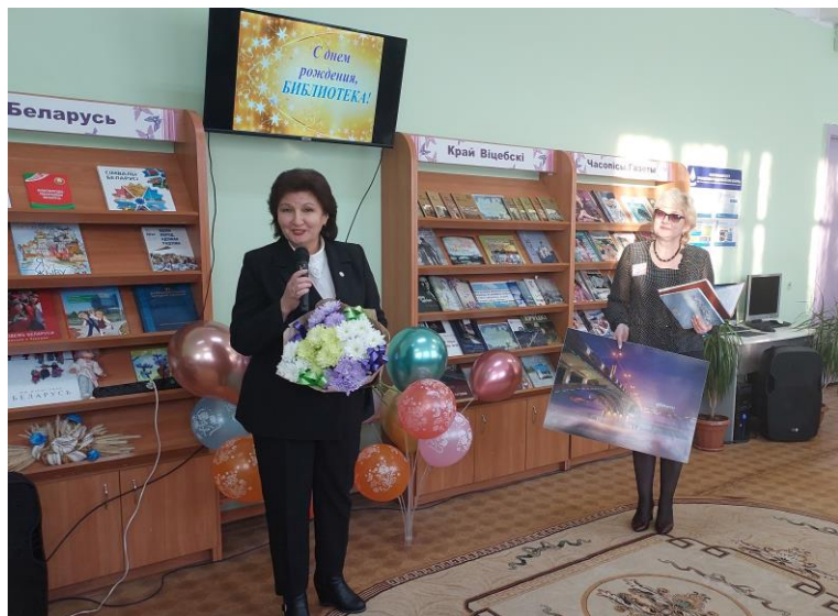
”55-гадовы юбілей“ Бібліятэка-філіял № 9 імя С. Маршака ЦБС г. Віцебска