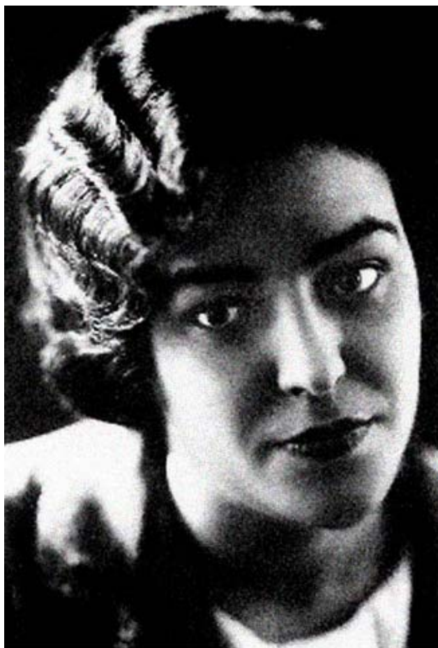
Вероника Тушнова (27.03.1915 г. - 07.07.1965 г.)