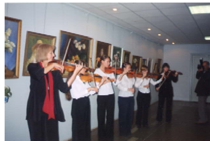
На адкрыцці персанальнай выставы ў Віцебскай абласной бібліятэцы, 2004 г.