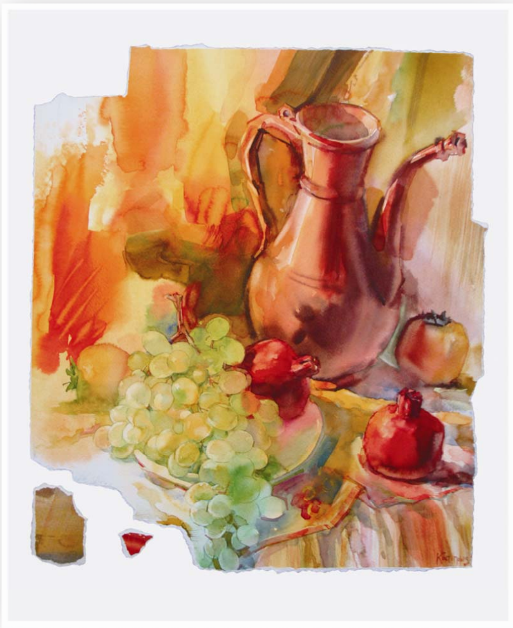
Натюрморт с виноградом, 2004г.