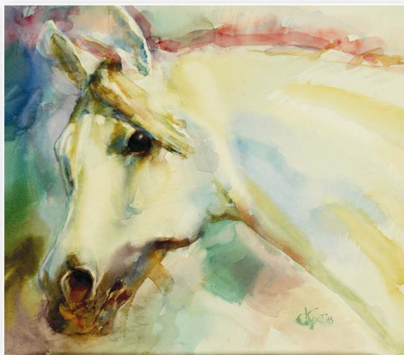
Портрет арабского скакуна, 1998г.