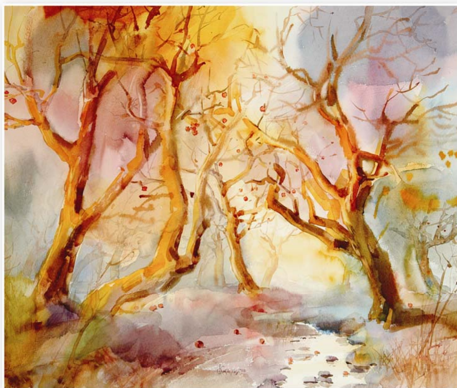
Осенние заморозки, 2000г.