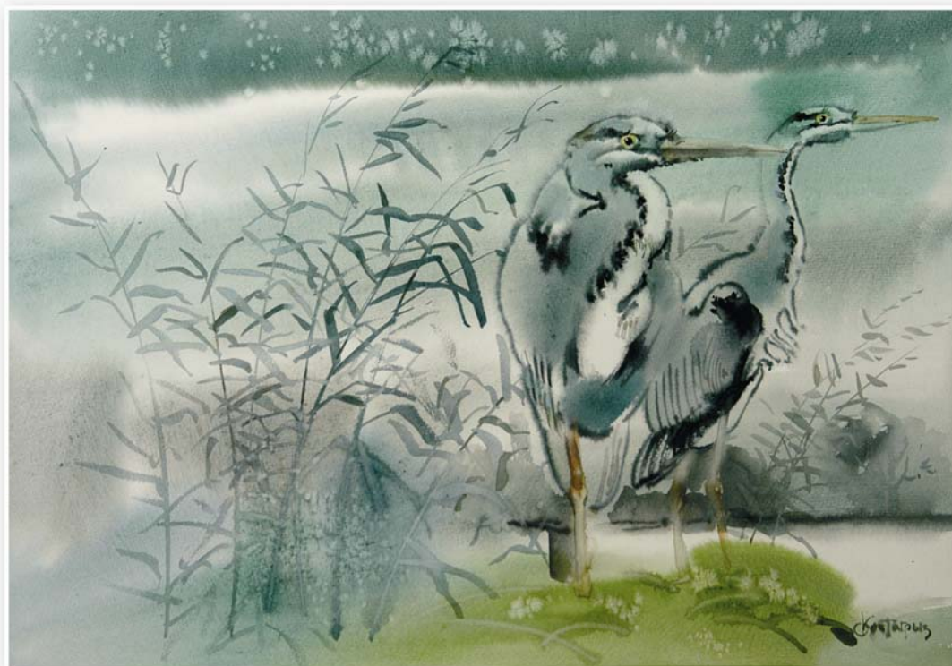
Утро на озере, 2001г.