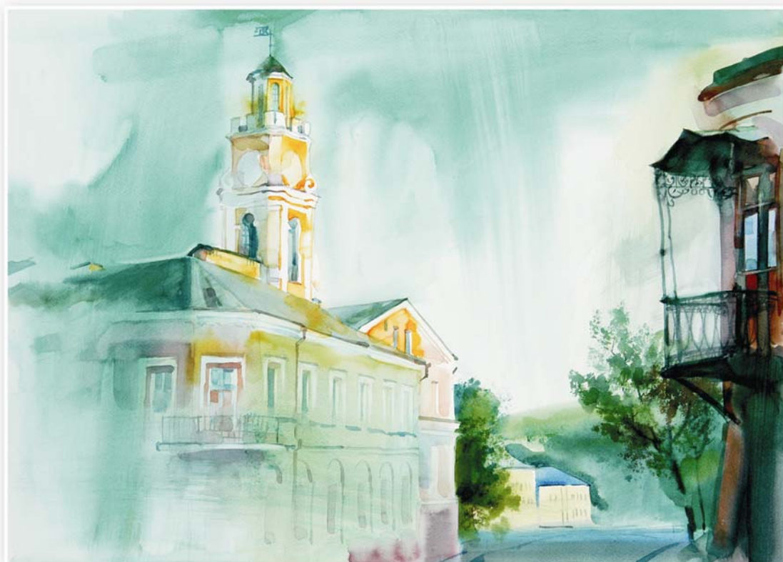
Витебск. Ратуша, 2001г.